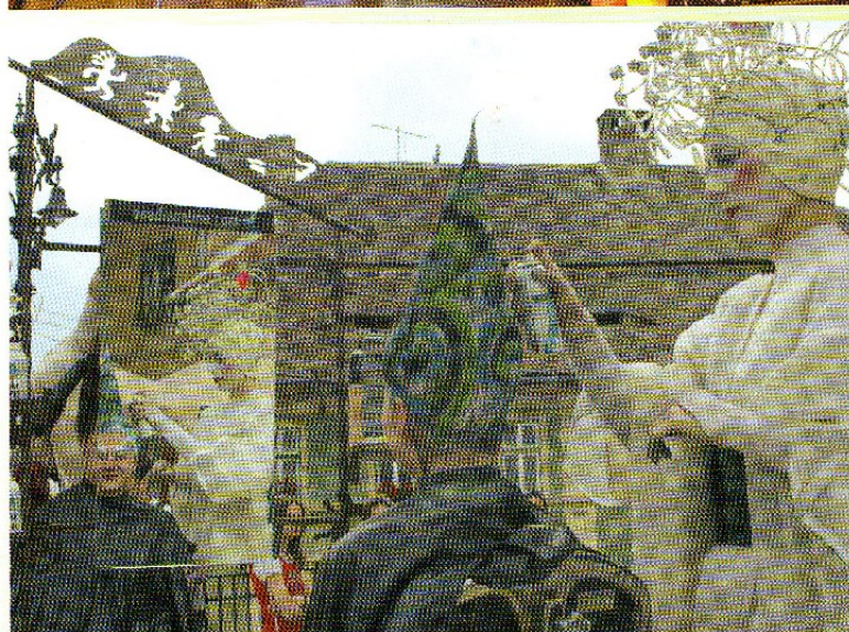
Osadia Whose hair dares